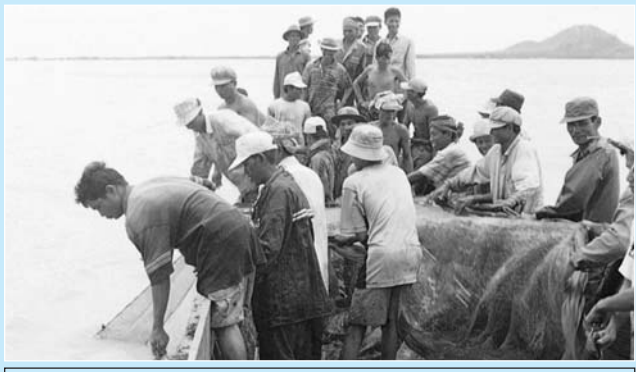
សហគមន៍ជាច្រើនមានការអាក់អន់ចិត្តខ្លាំងឡើងៗដោយសារជម្លោះ ដីខ្លាំងក្លានិងកង្វះដំណោះស្រាយលើបញ្ហានេសាទ។ ជាញឹកញាប់, សហគមន៍មួយចំនួនបានសម្រេចដោះស្រាយបញ្ហាដោយផ្ទាល់ដៃ ខ្លួនឯង។ ឧទាហរណ៍ការរឹបអូសឧបករណ៍នេសាទខុសច្បាប់ដូចដែល បានបង្ហាញតាមរយៈរូបភាពខាងលើដែលកើតឡើងក្នុងខេត្តតាកែវ។

នៅមុនពេលដែលអង្គការមិនមែនរដ្ឋាភិបាលចាប់ ផ្តើមធ្វើការសិក្សាទៅលើបញ្ហាជលផល សហគមន៍នេសាទ ដែលទទួលបាននូវការប៉ះពាល់ធ្ងន់ធ្ងរបានប្រើប្រាស់វិធីសាស្ត្រ របស់គេរួចទៅហើយនៅក្នុងការដាក់ការគាបសង្កត់ទៅលើ រដ្ឋាភិបាល។ ខុទ្ទកាល័យរបស់នាយករដ្ឋមន្ត្រី គឺជាគោលដៅ នៃលិខិតដែលប្រកបដោយការខឹងសម្បាររបស់សហគមន៍ ការធ្វើបាតុកម្មនៅមុខរដ្ឋសភាជាតិ និងការគាបសង្កត់ពី អន្តរការីនៅក្នុងខុទ្ទកាល័យនាយករដ្ឋមន្ត្រី។ ទោះបីជាវិធី ធ្វើការតស៊ូមតិបែបនេះពិតជាចេញមកពីបំណងពិតប្រាកដ នៅក្នុងការគាបសង្កត់ទៅលើរដ្ឋាភិបាលក្តី តែគេពិបាកនឹង វាស់វែងបានពីប្រសិទ្ធភាពរបស់វាណាស់។ អ្នកខ្លះមានការ សង្ស័យថា បច្ចេកទេសទាំងនេះមានប្រយោជន៍ណាស់នៅ