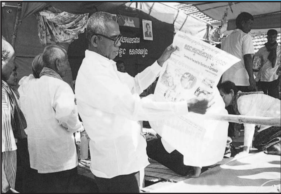
អង្គការត្រួតពិនិត្យការបោះឆ្នោតចែកចាយព័ត៌មានដល់តំបន់ជនបទ

សេចក្តីផ្តើមរបស់មេធាវី , ការសំណុំរឿងប្រឈមមុខ និង មេរៀន